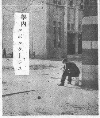
學内ルポルタージュ

本校の学生が、最近「学内ルポルタージュ」の発行に着手した。これは、本校の生活、学業、スポーツ、文化活動などについて、学生自身が取材し、執筆して発表するものである。