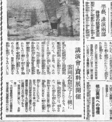
講義 雲石石室を機に

共済部強化へ! 委員募集に乗り出す 共済部の強化に向けて、委員の募集が積極的に行われている。