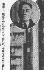
本紙佛譯フランスへ

外科病舎の落成式が行われた。外科病舎の落成式が行われた。外科病舎の落成式が行われた。