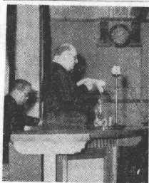
ペルー前首相の講演