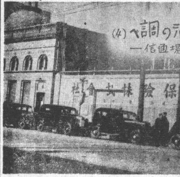
本報記者 山本君 記者 山本君