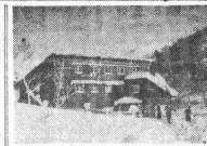
本報記者 山本君 記者 山本君