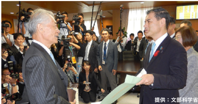
柴山文部科学大臣を訪問

10月11日(木)、山極総長とともに、柴山昌彦 文部科学大臣、平井卓也 科学技術政策担当大臣および根本 匠 厚生労働大臣を訪問し、座右の銘である「有志竟成(ゆうしきょうせい)」と揮毫した色紙を手渡し、受賞の報告を行いました。