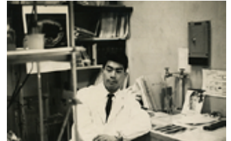
京都大学大学院医学研究科時代