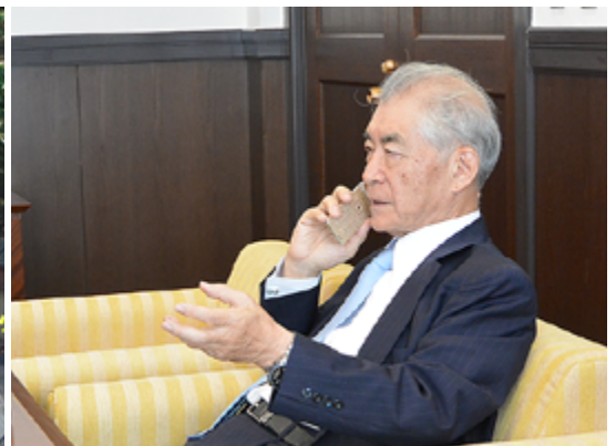
海外メディアからの電話取材(10月2日)