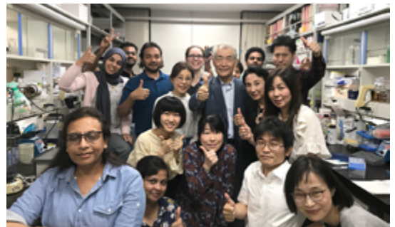
受賞決定直後の研究室

研究室一同、本席先生がノーベル賞を受賞されたことを心からお祝い申し上げます。当日は思いがけず本席先生から受賞を伺い、皆、歓喜に湧き上がりました。日が経つにつれ、日本をはじめ世界中のがん患者さんやご家族の方々がどれほどこの治療法に期待を寄せられているか、をますます実感しています。今後も本席先生のご指導を受けつつ、この研究の発展に微力ながら貢献させていただきたいと決意を新たにいたしました。