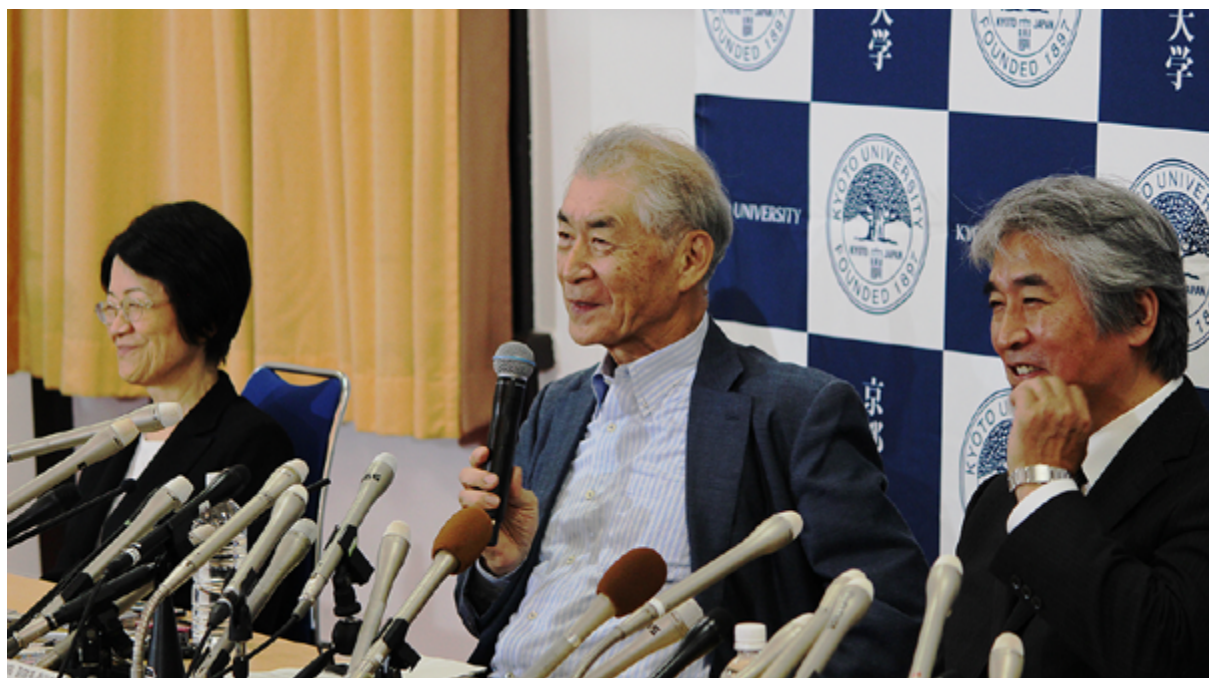
百周年時計台記念館での受賞報告記者会見(10月1日)

10月1日(月)18時30分(日本時間)にノーベル生理学・医学賞の発表があり、本庶 佑(ほんじょ たすく)高等研究院副院長・特別教授が受賞されました。授賞理由は「免疫抑制の阻害によるがん治療法の発見」です。