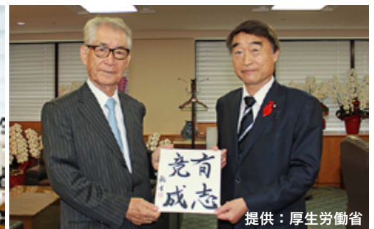
根本厚生労働大臣を訪問