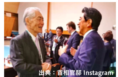
安倍総理大臣と会談

10月7日(日)、京都国際会議場で開催された「科学技術と人類の未来に関する国際フォーラム(STSフォーラム)」に参加していた安倍総理大臣に、受賞の報告を行いました。