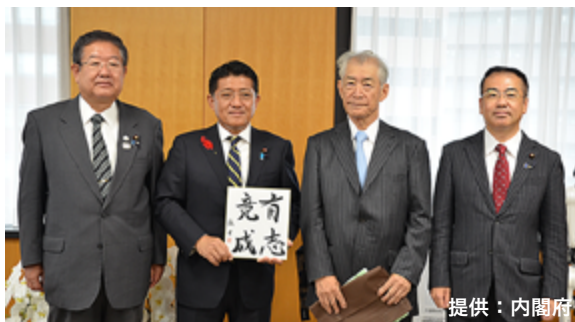
平井科学技術政策担当大臣を訪問