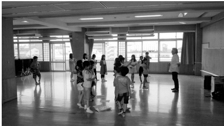
写真1: 普段の練習の様子（2018年6月14日）