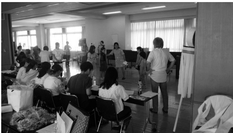
写真2: 本番前の練習は、多数の劇団関係者と合同で行われた（2018年7月1日）