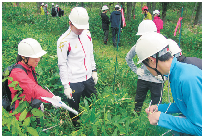
皆伐前の人工林における下層植生調査の様子

の生活がどのように関わっているのかを実際に肌で感じてもらうだけでなく、普段はあまり交流の機会がない大学間の学生がつながりを持ってたかと思えます。今年度は特に昆虫相調査を加えたことで、普段はあまりなじみがなく虫を気味悪がっていた学生が、徐々に虫に慣れていく様子が見て取れました。今回行ったような調査は実習が終わった後でも簡単に再現できます。また昆虫も樹木も日本のあちこちで見かける生物です。ふと「ああそういえば、こんなことをして調べていたな」と思い出すことで、これまで見逃していた生き物の面白さに気が付けるかもしれません。実習という非日常での体験が、普段の生活をさらに楽しいものに変えていければ幸いです。