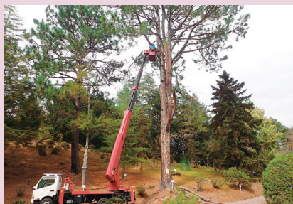
高所作業車によるマツの剪定作業 （上賀茂試験地）