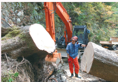
台風21号被害復旧作業モミの倒木除去 （和歌山研究林）