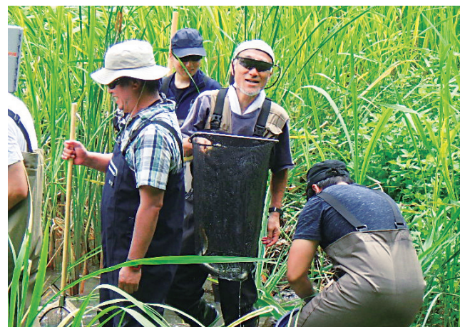
森里海連環学プロジェクトの調査（白浜町） 網の中にはウナギ！

21世紀には、調和ある持続的な地球社会を構築せねばなりません。そのためには、全体最適化の哲学が不可欠です。全体最適化とは、個別最適化の反省にたち「持続的な全体の幸福や利益」を最大化する方向性です。その実現のためには、生産性、効率、経済的利潤だけでなく、長期的な視点で持続性、共生、多様性を重視し、自然環境の保全という生態学的コストを支払うことが必要です。森里海連環学は、調和ある持続的な社会の構築をめざし、森から海までの自然と人間社会の新しい関係を考えようとする学問分野です。