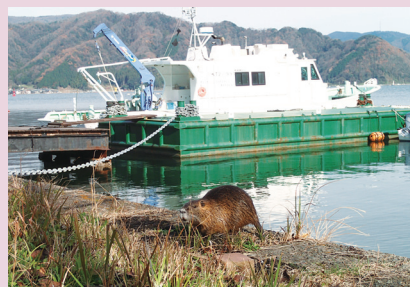
ヌートリアが緑洋丸棧橋付近に出没 （舞鶴水産実験所）