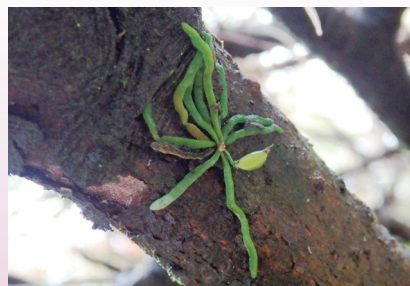
樹幹に着生したクモラン （上賀茂試験地）