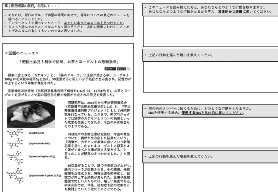
図1 開発したパフォーマンス課題(課題1)