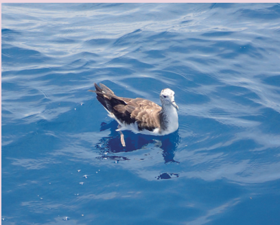
緑洋丸に近づいてきたオオミズナギドリ (舞鶴水産実験所)