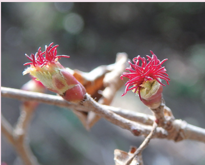
ツノハシバミの雌花 (上賀茂試験地)