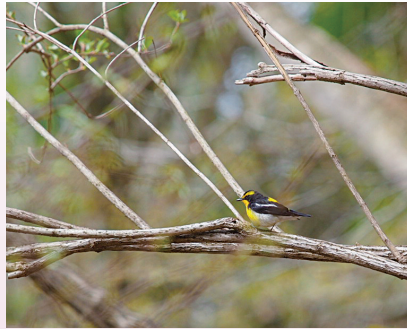
夏鳥として研究林に渡ってきたキビタキ (芦生研究林)