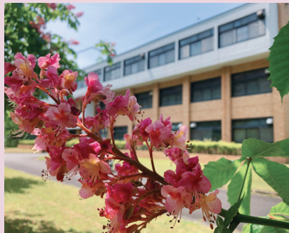
標本館前で咲き誇るベニトチノキ (舞鶴水産実験所)