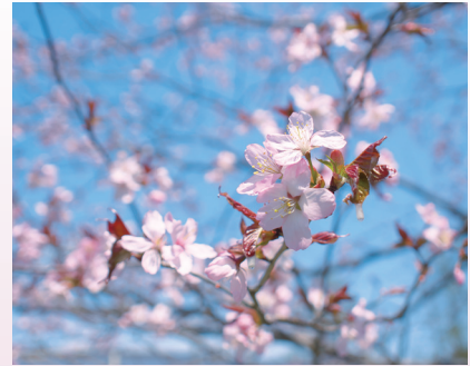
5月の桜 (北海道研究林)