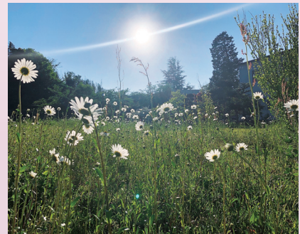
満開のマーガレット (舞鶴水産実験所)