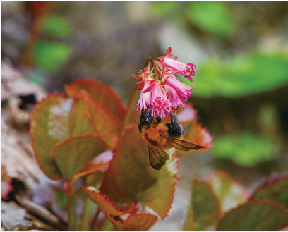
オオイワカガミを訪花するトラマルハナバチ (芦生研究林)