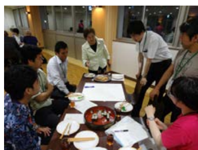
6月 持続可能性講演・交流会