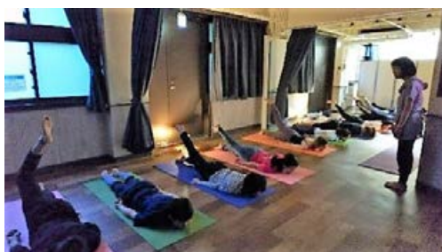
健康デー(ヨガ・太極拳)