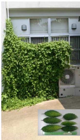
農学研究科(6年連続)

環境科学センターでは2012年より本プロジェクトを開始しており、種から育てたゴーヤを、希望者(里親)にお配り、育てて頂いております。学内の落ち葉で作った堆肥もあわせて、ご活用頂いております。平成30(2018)年度は自宅も含め里親59名、186苗を提供し、堆肥(腐葉土)は51名100袋(約1,000kg)を持ち帰られました。自ら育てた実から種を植える方や毎年新しく挑戦される方がおられる一方、7年連続参加も1カ所ありました。