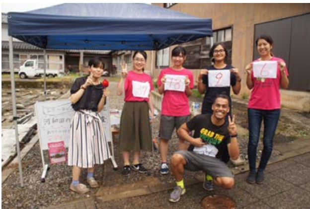
河和田アートフェス内の福女・福男レースに参加