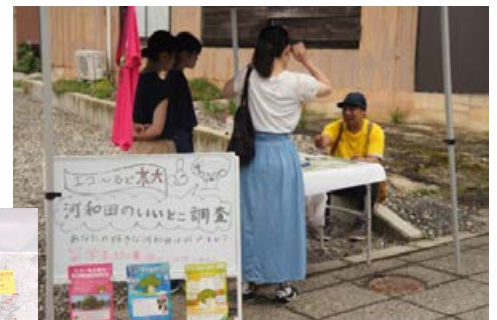
河和田地区のいいところ調査の様子