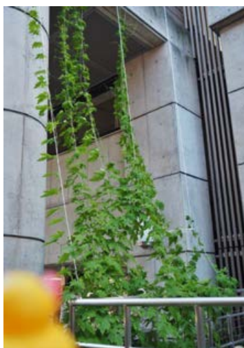
工学研究科(本部地区)