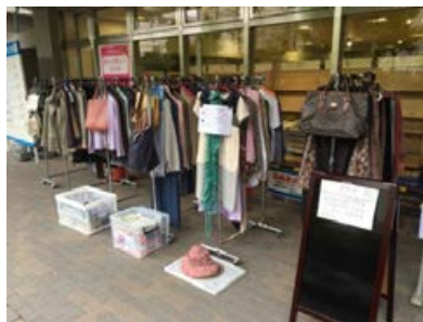
チャリティーフリマ