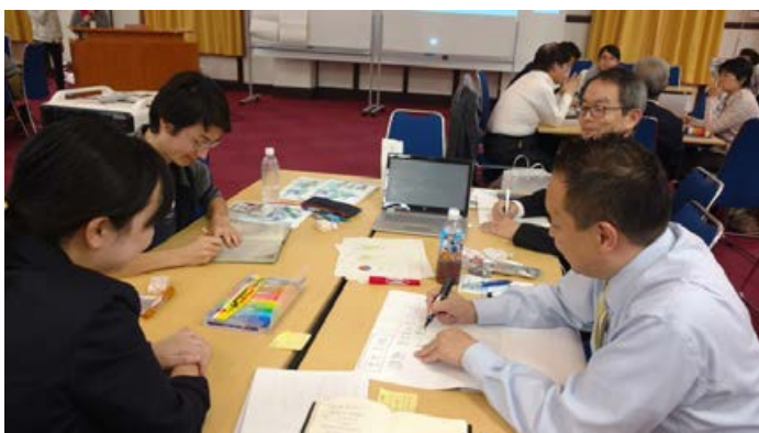
フードポリシーことはじめワークショップ