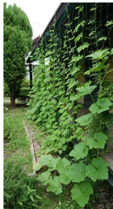
森里海連官学教育 研究ユニット