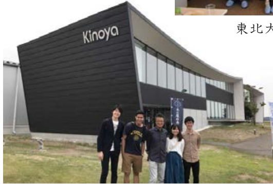
木の屋石巻水産の方と