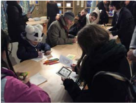
ポーランドでのワークショップ