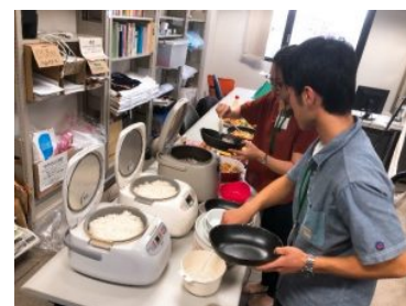
日本のご飯を味わう会