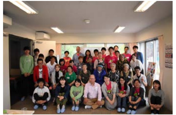
東北大学、復興公営住宅の方たちと