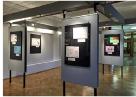
カピツェでの小中学生のポスター展示