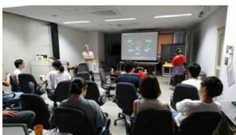
セプテンバー11上映会