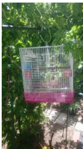
本部事務局 (インコに日陰を)