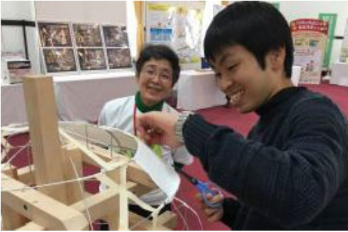
学生や市民と協働したねぶた作りの様子