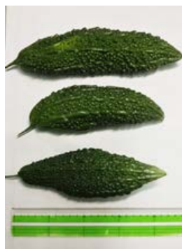
環境科学センター で収穫されたゴーヤ