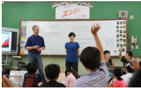
小中学校での環境教育の様子