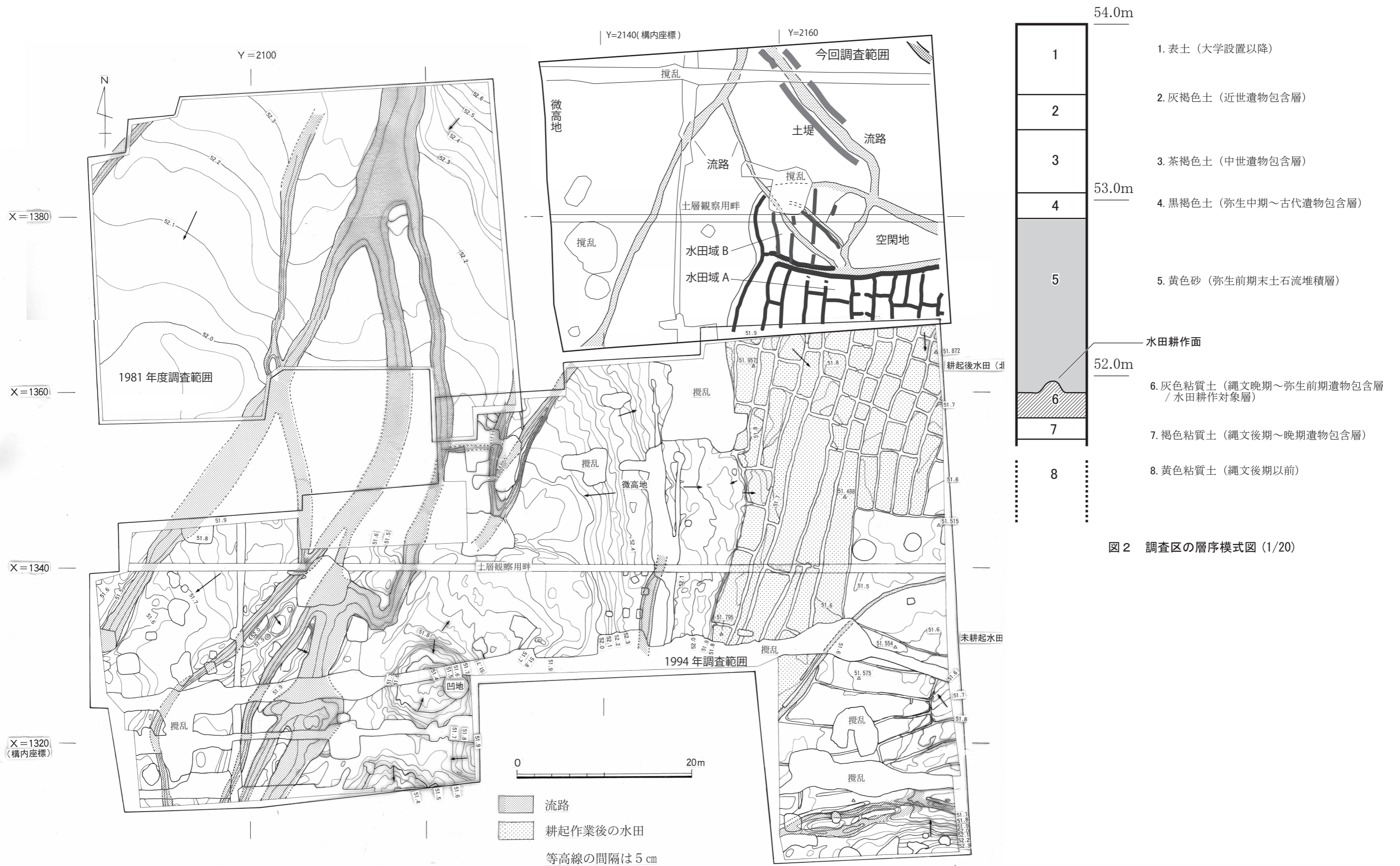
図2 調査区の層序模式図 (1/20)