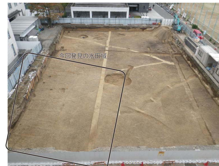
参考：今回発見の水田遺構（東から）