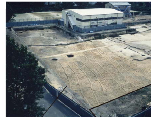
1994年調査時の水田遺構（北東から）