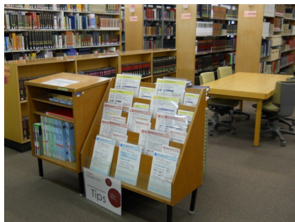
人環・総人図書館Tipsコーナー(レファレンスカウンター前)

この3つの方法以外にも、たとえば、近隣の公共図書館(京都府立図書館や京都市立図書館など)で利用できる場合もありますし、ご自身で購入したほうが早い場合もあるかもしれません。