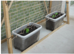
(6/6 植えた日のゴーヤ)