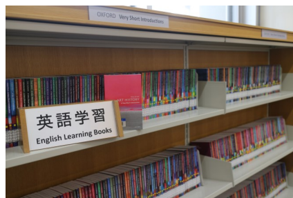
2階 英語学習コーナー

当館の英語学習コーナーを利用して、まずは英語に慣れ、次に例えばポピュラーサイエンスと言われるジャンルで、日本語訳もある洋書に挑戦し、最終的に分厚い学術書を駆使していってもらえると嬉しいです。