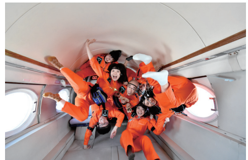
パラボリックフライトの様子

本センターは、この教育プログラムのカリキュラムや評価のデザインに協力しています。授業評価として学生に対するフォーカスグループ・インタビューの実施や、学習活動・学習評価としてコンセプトマップの作成（事前・事後）などを提案・支援しています。本調査の結果は、宇宙ユニットシンポジウムや大学教育研究フォーラムでも報告されています。