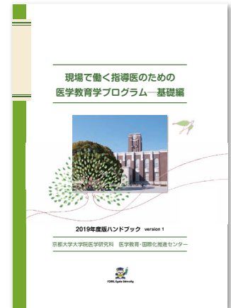
2019年度版ハンドブック ( http://cme.med.kyoto-u.ac.jp/fcme/handbook.pdf )