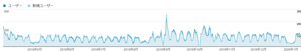
図1 2019年度ユーザー数の推移

今後も京都大学の教員のみなさんが、オリジナルの教育手法について考える上でのきっかけとなるような情報を発信したり、また授業構成を考えるヒントを探す上で有益なベテラン教員のインタビュー記事を掲載したり、現代日本の高等教育について考えるフォーラム等の情報が見えるようなサイトとして、活用していただけるよう、アップデートしていく予定です。ぜひ、当ウェブサイトを訪ねていただき、ご質問やご要望、情報提供などいただけると幸いです。