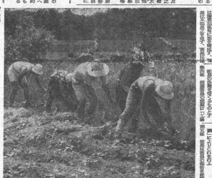
入動員視察班の調査の様子