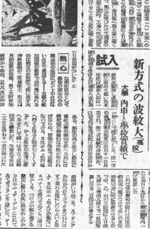
明日の飛機を擔ふもの 明日の飛機を擔ふもの