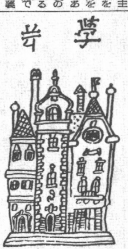
新刊政治哲學の急務