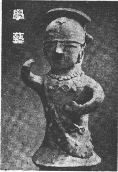
考古學の歴史的使命