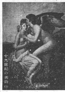
モーロツの大衆生活 瀬田 大衆