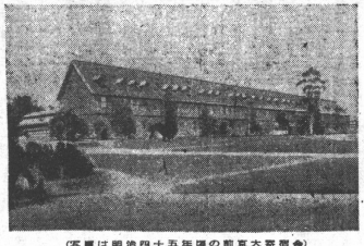
京大の歴史を語る、その歩みは、時代の激変と共に、常に挑戦と革新を繰り返してきた。

京大の歴史は、明治維新の精神を継承し、自由と正義の道を進んできた。その歩みは、時代の激変と共に、常に挑戦と革新を繰り返してきた。