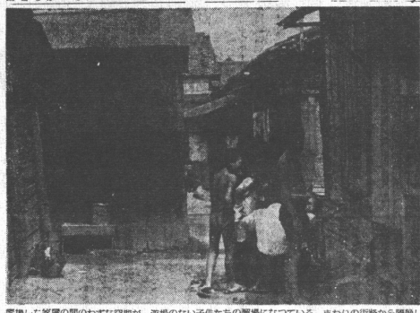
夏季調査團のレポート 第一号 海産物の推定