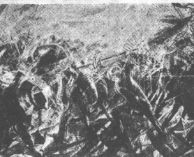
モダン・アートの系譜 (3)

「もの見方」がうける。同じ買うなら、学術書。最近の読書傾向は、学術書への関心が高まっている。これは、社会の発展に伴って、知識の探求が盛んになったためである。