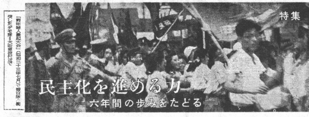
民主化を進める力 六年間の歩みをたどる

新憲法の公布は、我が國の歴史に亙る一大事業に當り、國民の心を一新し、國家の前途を光明に照らすこととなる。