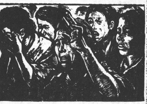
松川の陣たち 新居広治作

労働運動の展望は、戦後の歴史を振り返る必要がある。戦後の労働運動は、大きく分けて二つの時期に分けられる。戦後直後の時期と、戦後中期の時期である。戦後直後の時期は、労働運動が活発化し、労働組合の組織率が大幅に上昇した。戦後中期の時期は、労働運動がやや低調になり、労働組合の組織率も伸び悩んだ。今年の労働運動の展望は、戦後直後の時期を再び目指すことが求められる。