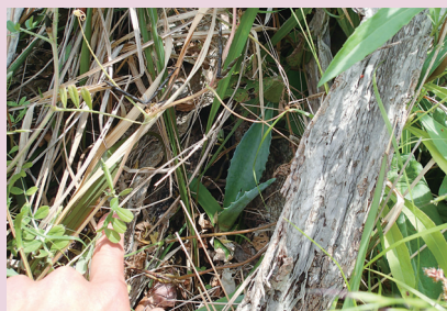
アオノリュウゼツラン開花後に枯れた親株の 根本に子株が育つ (舞鶴水産実験所)