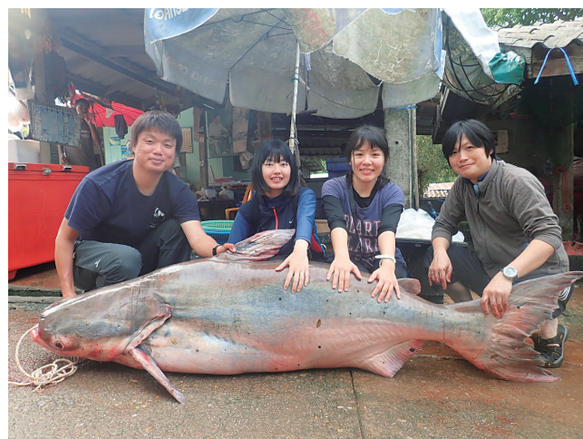
メコンオオナマズと著者（右から1人目）

これまで主に魚類を対象として、水産資源動物の維持管理と絶滅危惧種の保全のために、対象動物が「い