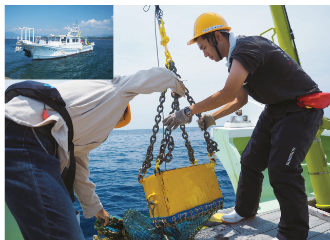
白浜沖にて、ヤンチナによるドレッジ調査の様子

船舶を運航時には、船舶免許等の資格がある技術職員が最低2名、調査等を行う場合には3名が乗船し航行・作業時の安全を確保しています。また年に1回船を陸に揚げ、船体・機器等の点検や、消耗品の交換、船底塗装などのメンテナンスを行い日々の安全運航に努めています。