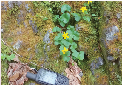
リュウキンカとGPS (芦生研究林)