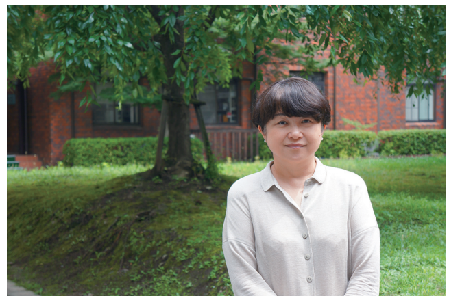
京大稲盛財団記念館裏庭にて

フィールド研では、森里海連環学における「人」に着目した研究、とくに自然とのつながりや自然に親し