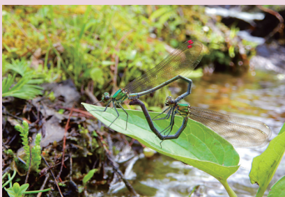
ハート形のように見えるアサヒナカフトンボの カップル (上賀茂試験地)