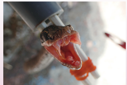
事務所構内で捕獲したマムシ (和歌山研究林)