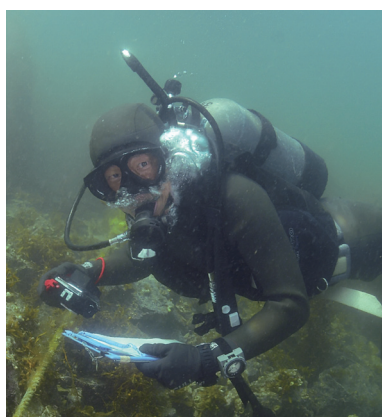
気仙沼舞根湾での潜水調査 (2017年7月15日)

この4月から里海生態保全学分野の教授に着任しました。助手として舞鶴に来たのは2000年4月ですので、新人と称する鮮度でもありません。前任地であるハワイの研究所の上司は、「いつでも帰って来い」と送り出してくれたのですが、舞鶴の魚はおいしく、山の緑は濃く、また寛容な上司と優秀な同僚や学生に恵まれて、楽しく過ごしてきました。