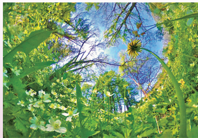
ニリンソウとタンポポ (北海道研究林)