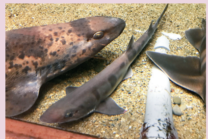
ナヌカザメ(上)と、水深200m付近で採集 されたニホンヤマモリザメ(中央) (瀬戸臨海実験所)

https://fserc.kyoto-u.ac.jp/zp/nl/news51