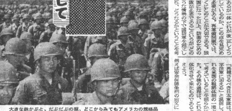
大々な兵隊と、たぶたぶの服、どこからみてもアメリカの規格品である。この服を日本の青年全部に置きよという人もある。