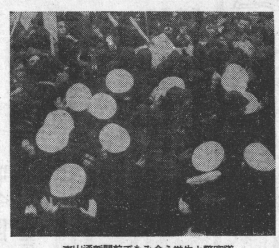
東山通前門前でもみ合う学生と警官

府学連、激しいデモ展開 知恩院前で警官と衝突 去(六)日の第二十二回メーデーデモは、京大府学連が中心となり、京大の三千人の学生が参加し、二階のデモ隊を出発し、三千人の学生がデモ隊に加入して、知恩院前までデモ隊を押し進めた。デモ隊は、知恩院前まで進み、警官と衝突した。デモ隊は、警官の押寄せを拒み、激しいデモを展開した。デモ隊は、知恩院前まで進み、警官と衝突した。デモ隊は、警官の押寄せを拒み、激しいデモを展開した。