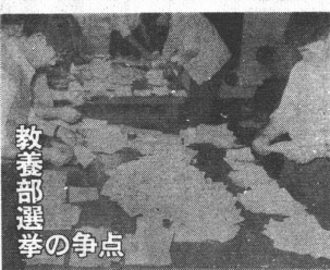
救養部選挙の争点

【本報記者 青島】明らかにされなかった出資者の名前が、最近、再び世間の注目を浴びた。この問題が、いかに重大なものであるかを、改めて認識させるべきである。この問題が、いかに重大なものであるかを、改めて認識させるべきである。 明らかにされなかった出資者の名前が、最近、再び世間の注目を浴びた。この問題が、いかに重大なものであるかを、改めて認識させるべきである。この問題が、いかに重大なものであるかを、改めて認識させるべきである。