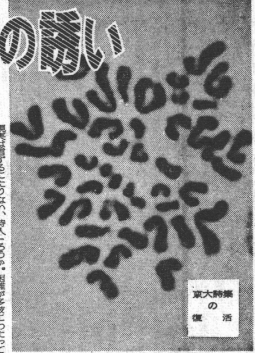
京大アンソロジーの表紙

「京大アンソロジー」(以下「アンソロジー」)は、京大の学生が、その自由な学問の探究と、その自由な表現の欲求から、自らの手で創り出した、京大の文化の結晶である。 アンソロジーは、京大の学生が、その自由な学問の探究と、その自由な表現の欲求から、自らの手で創り出した、京大の文化の結晶である。