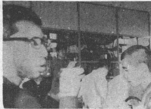
資本家は生け花の手で行なわれる。なごやがではあるが、旗竿は生花の筒に挿し込まれている。

「工専(正式名は工業高等専門学校)は発達途上にあり、その現状を明らかにし、今後の発展を期す」というのが、本誌の趣旨である。本誌は、昭和38年11月の創刊以来、この趣旨を貫き、工専の現状を、その発展の過程を、その将来の展望を、多方面から、多岐にわたって、調査・研究し、その成果を、本誌を通じて、広く、一般に公表して来た。その結果、工専の現状は、概して、好ましいものがある。