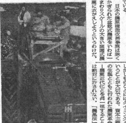
農業機械の普及による農業生産の近代化。しかし、生産コストの上昇が採算を脅かしている。

昭和33年度の農業構造改善政策は、機械化の促進に重点が置かれた。これは、戦後最大の機械化推進策といえる。しかし、この政策は、経済的には採算とれぬという問題を抱えている。 農業構造改善政策の中心は、農業機械の普及と、農業生産の近代化にある。戦後、日本の農業は、戦前と比べて、生産力が増進し、食糧自給率が向上した。しかし、農業の生産コストは、戦前よりも大幅に上昇した。これは、農業機械の普及によるものである。農業機械の普及は、農業生産の効率を向上させたが、同時に、農業の生産コストも大幅に上昇させた。これは、農業の生産コストが高騰したため、農業の採算がとれなくなったという問題を抱えている。