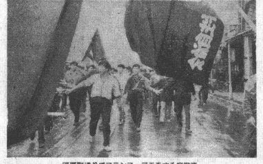
河原町通りでフランス・デモをする若学生

【本紙記者東京二十日電】全国の学生ゼネストは、五月三十一日に活発な動きを見せよう。教養部は、三十日に代議員大会を開く。この大会は、全国の学生ゼネストの代表者が集まり、今後の行動方針を決定する。また、教養部は、五月三十一日に、全国の学生ゼネストの代表者を招き、懇談会を開く。この懇談会は、全国の学生ゼネストの代表者と教養部の代表者が話し合い、今後の行動方針を決定する。また、教養部は、五月三十一日に、全国の学生ゼネストの代表者を招き、懇談会を開く。この懇談会は、全国の学生ゼネストの代表者と教養部の代表者が話し合い、今後の行動方針を決定する。