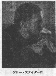
グリー・スナイダー画

超現実的精神生活への探求。非合理精神への共鳴。超現実的精神生活への探求。非合理精神への共鳴。超現実的精神生活への探求。非合理精神への共鳴。