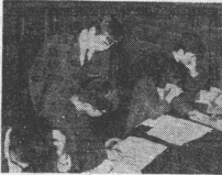
カベを破るか「ロシア学」

望まれる総合研究。老朽化の講座制。カベを破るか「ロシア学」。望まれる総合研究。老朽化の講座制。カベを破るか「ロシア学」。