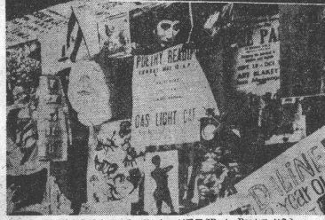
アメリカのグリニッチ・ボート・レース (Boat Race) がら

西洋文明の脱出者としての東洋文化の求むるもの。西洋文明の脱出者としての東洋文化の求むるもの。西洋文明の脱出者としての東洋文化の求むるもの。