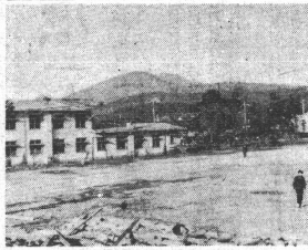
新寮建設予定地の教育学部校舎

教育学部が新寮に移転した。これは、新寮建設の第一歩として、去年十一月に開始された。移転作業は、新寮建設委員会を中心に、新寮建設部、新寮建設委員会、新寮建設作業部会、新寮建設作業員などによって行われた。移転作業は、新寮建設の第一歩として、去年十一月に開始された。移転作業は、新寮建設委員会を中心に、新寮建設部、新寮建設委員会、新寮建設作業部会、新寮建設作業員などによって行われた。