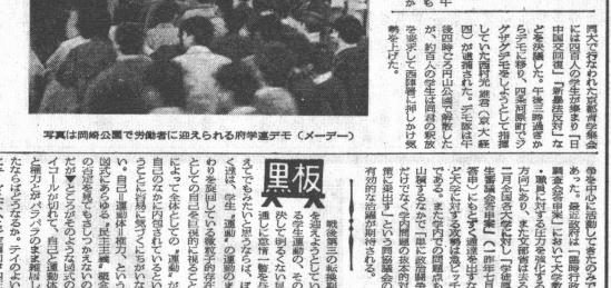
写真は同略公園で労働者に迎えらる府学連デモ（メーデー）

学術会議で要望が可決された。京大に霊長類研究所の設置が学術会議で可決された。また、学術会議で要望が可決された。京大に霊長類研究所の設置が学術会議で可決された。