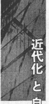
保田と重部の「復活」とは何か