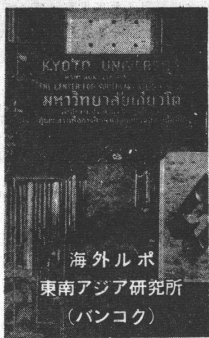
海外ルポ 東南アジア研究所 (バンコク)