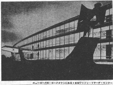
ニューヨーク州・ヨークタウンにあるIBMワトソン・リサーチ・センター

IBMは、世界100カ国以上へ進出している。その驚異的な発展は、世界のビジネス界に大きな影響を与えている。IBMの製品は、世界中の企業や政府機関に広く採用されている。これは、IBMの技術力と信頼性の証である。 IBMの成長は、主に以下の要因による。第一に、高度な技術の開発と革新。第二に、世界的なマーケティング戦略。第三に、顧客に対する優れたサービスとサポート。 IBMは、今後も世界のリーダーとして成長を続ける予定である。最新の技術と製品を、世界中の顧客に提供し続けることを目指している。