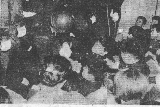
学内に導入された警官が学生をゴボゴボ一頁にする