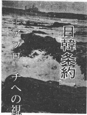
「日韓条約」 アプローチへの視点