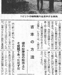
トビシの植物園内を見守る障子

「吉本の方法」は、著者の自伝的なエッセイである。著者は、自身の生い立ちや、戦時中の体験、戦後の生活について詳しく語っている。著者は、戦時中の苦しい生活や、戦後の混乱期にあって、どのように生きてきたかを語り、自身の思想的成長の経緯を明らかにしている。著者は、戦時中の国家主義や権威主義からの脱却を求め、戦後の民主主義を真に受け入れ、その精神を基盤として、新たな思想的拠点を築くべきであると説く。この書は、戦後日本の思想界に大きな影響を与え、多くの若者に読まれ、その思想を継承する者が出てきた。本書は、戦後日本の思想史において重要な一冊として位置づけられるべきである。