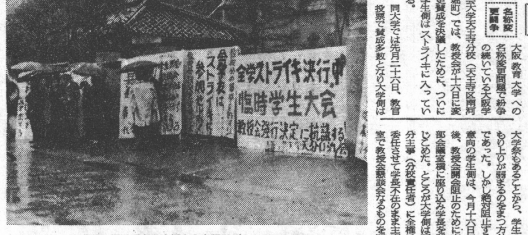
全学無断でストを決定した大阪学大の学生側(左)と教職員側(右)の衝突場面