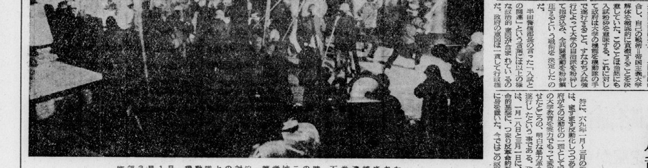
昨年3月1日、運動場での対立。被告団の側、不当逮捕された

一、公訴の政治的不当性 原告は、被告団が京大の入試を阻止したと主張し、損害賠償を求めた。被告団は、京大の入試は憲法に違反するものであると主張し、原告の主張は憲法に違反するものであると反論した。 被告団は、原告の主張が法的にも社会的にも正当でないことを明らかにした。原告の主張は、憲法に違反するものであると主張し、被告団の主張は憲法に違反するものであると反論した。