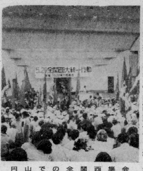
円山での全関西集會

全関西の労学が、六月十四日(土)の夜、東京の丸の内駅前に集結した。この集結は、戦後初めての大規模な労学結集であり、全国の労学が、この集結を機に、全国的な闘争の準備を進めようとする意向を示した。集結には、全国の労学が、約二千名参加した。集結は、午後八時から始まり、約二時間の集結会が行われた。集結会では、全国の労学が、この集結を機に、全国的な闘争の準備を進めようとする意向を示した。