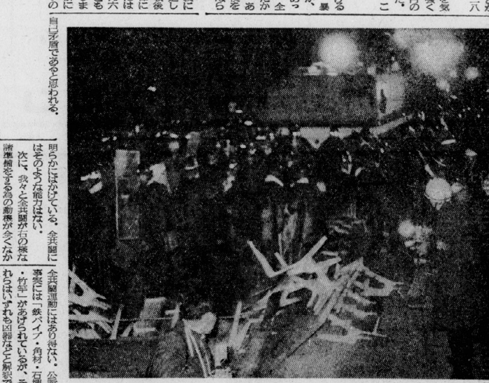
被告団の側、不当逮捕された

法的矛盾にみちた起訴 全共闘運動への弾圧策す 原告の起訴状は、法的矛盾にみちたものである。被告団の主張は、全共闘運動への弾圧策すであると主張し、原告の主張は法的矛盾にみちたものであると反論した。 被告団は、原告の主張が法的にも社会的にも正当でないことを明らかにした。原告の主張は、憲法に違反するものであると主張し、被告団の主張は憲法に違反するものであると反論した。