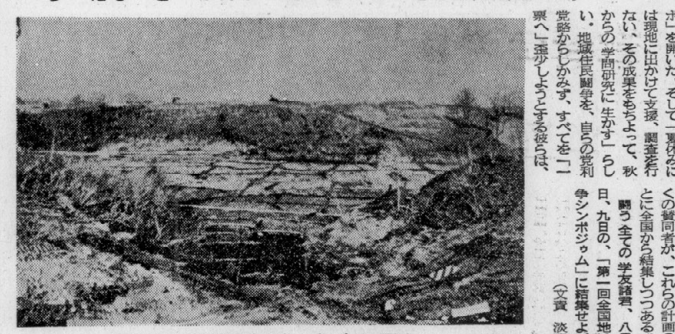
日々耕作地が工事現場に変わっていく (三里塚)

三里塚闘争は、戦後の日本の社会運動の歴史の中で、重要な位置を占めている。この闘争は、戦後の日本の社会運動の歴史の中で、重要な位置を占めている。