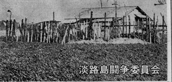
淡路島闘争委員会

昨年来、熾烈に闘われた大長征が、東北に留まらず、そのもつてきた学生の間で、激しいエネルギーを、職能闘争へと燃焼させようとする動きが、全国的に展開されてきた。70年6月闘争を踏まえ、ブルジョア階級の全面的な政治社会秩序の帝国主義的再編の攻撃の中で、この攻撃と真に決着する運動の展開が要求されている。前回の本紙編集委員の決議に対する提起を受けて、今回は、淡路に闘争の結核、今後の方向性を提起して見よう。