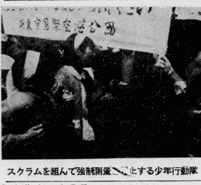
スクラムを組んで強制測量、止する少年行動隊

「映画運動」の不鮮明さ 「映画運動」の目的は、社会の現状を映写し、人々の心を動かすことにある。しかし、その手段や方法については、各グループがそれぞれ異なる考えを持っている。これは、映画運動の発展にとって、むしろ良いことかもしれない。しかし、同時に、この不鮮明さが、社会に対して十分な影響力を及ぼすことができない原因にもなっている。映画運動のリーダーたちは、この問題をどう解決していくべきか、真剣に考えている。