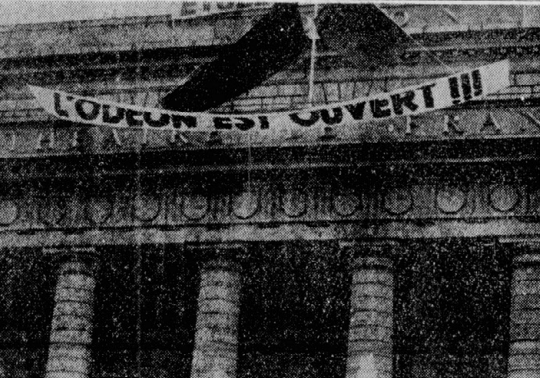
68年5月、労働者・学生によって占拠されるパリ・オデオン座