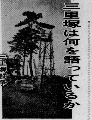
三里塚闘争 中間総括に向けて

10・21闘争は、学生運動の歴史に重要な一頁を刻みこんだ。その意義は、今日改めて見直さなければならない。この闘争は、単なる学生運動の延長線上にあり、社会運動としての性格を帯びてきた。その結果、学生運動のありかた、その目的、その手段、その組織、その思想、その行動、すべてが一新された。この闘争は、学生運動の歴史に重要な一頁を刻みこんだ。その意義は、今日改めて見直さなければならない。この闘争は、単なる学生運動の延長線上にあり、社会運動としての性格を帯びてきた。その結果、学生運動のありかた、その目的、その手段、その組織、その思想、その行動、すべてが一新された。