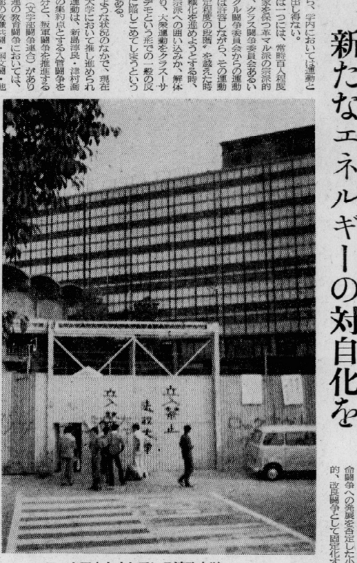
ロックアウトされている法政大学

新たなエネルギーの対自化を 三里塚闘争は、学生運動の歴史に重要な一頁を刻みこんだ。その意義は、今日改めて見直さなければならない。この闘争は、単なる学生運動の延長線上にあり、社会運動としての性格を帯びてきた。その結果、学生運動のありかた、その目的、その手段、その組織、その思想、その行動、すべてが一新された。この闘争は、学生運動の歴史に重要な一頁を刻みこんだ。その意義は、今日改めて見直さなければならない。この闘争は、単なる学生運動の延長線上にあり、社会運動としての性格を帯びてきた。その結果、学生運動のありかた、その目的、その手段、その組織、その思想、その行動、すべてが一新された。