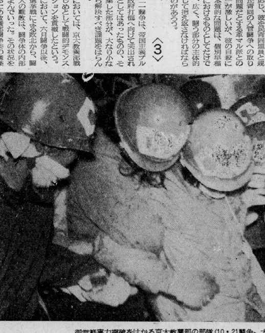
御堂筋暴力突破をはかる京大教員部の部隊(10・21闘争、大阪)

三里塚闘争は、学生運動の歴史に重要な一頁を刻みこんだ。その意義は、今日改めて見直さなければならない。この闘争は、単なる学生運動の延長線上にあり、社会運動としての性格を帯びてきた。その結果、学生運動のありかた、その目的、その手段、その組織、その思想、その行動、すべてが一新された。この闘争は、学生運動の歴史に重要な一頁を刻みこんだ。その意義は、今日改めて見直さなければならない。この闘争は、単なる学生運動の延長線上にあり、社会運動としての性格を帯びてきた。その結果、学生運動のありかた、その目的、その手段、その組織、その思想、その行動、すべてが一新された。