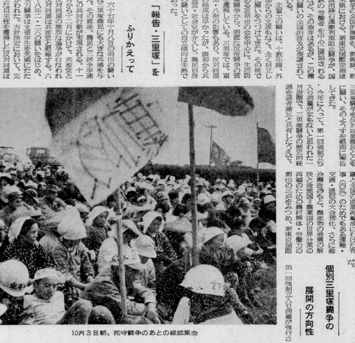
10月3日朝、死守闘争のあとの総括集会

三里塚闘争は、学生運動の歴史に重要な一頁を刻みこんだ。その意義は、今日改めて見直さなければならない。この闘争は、単なる学生運動の延長線上にあり、社会運動としての性格を帯びてきた。その結果、学生運動のありかた、その目的、その手段、その組織、その思想、その行動、すべてが一新された。この闘争は、学生運動の歴史に重要な一頁を刻みこんだ。その意義は、今日改めて見直さなければならない。この闘争は、単なる学生運動の延長線上にあり、社会運動としての性格を帯びてきた。その結果、学生運動のありかた、その目的、その手段、その組織、その思想、その行動、すべてが一新された。