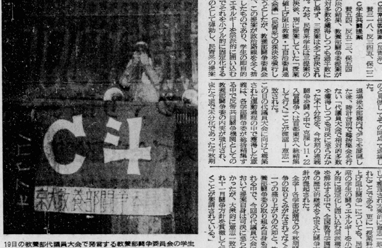
19日の教養部代議員大会で発言する教養部闘争委員会の学生

十一月十日午後、京大病院で発生した労働強化と安全確保の不備による事故で、一名が死亡した。事故の原因は、労働強化と安全確保の不備によるものである。 十一月十日午後、京大病院で発生した労働強化と安全確保の不備による事故で、一名が死亡した。事故の原因は、労働強化と安全確保の不備によるものである。 十一月十日午後、京大病院で発生した労働強化と安全確保の不備による事故で、一名が死亡した。事故の原因は、労働強化と安全確保の不備によるものである。