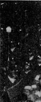
規制をはねのけて闘う労働者・学生 (22日 東京・青山通り)

11月22日、午後2時、東京・明治公園において、全国反戦・全国共闘・東京入管闘争・平運連の四者主催の下、全国より約2万5千人を総動員して行われた。この日の集会は、6月以來久しぶりの首都総決起闘争として、入管、沖繩、反軍闘争を軸に展開された今秋期闘争の集約として設定され、さらに入管法国会再上程および日韓法的地位協定に基づく「永住権」申請期限切れを前に入管闘争の全国的結合をかちとる闘いとして位置付けられた。