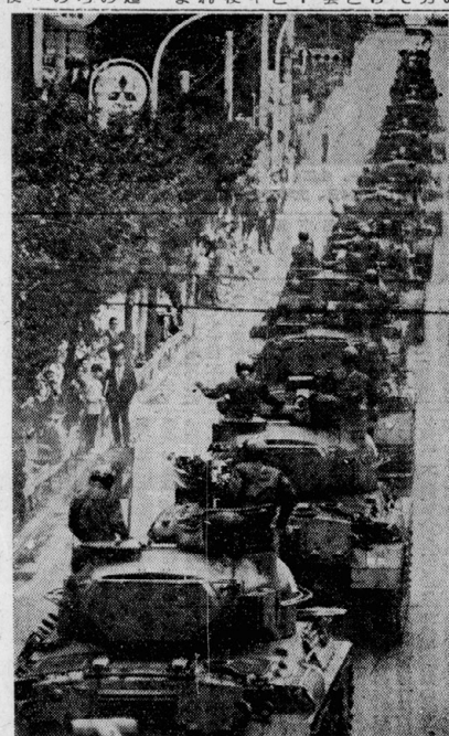
11月1日、創設20周年で都内をパレードする陸上自衛隊隊員

労働運動と自衛隊員との結合は、社会の解放に向けた重要なステップである。隊員たちは、労働者と同じく、社会の不正を正すための行動を起こしている。