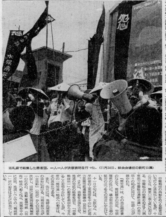
道礼姿で結集した学生団。一人一人が意思表示を行った。(11月24日、総会会場の新可公園)

全学新第25回全国大会の総括として、組織運動の原則を論じた。組織運動は、階級運動の全領域に向けて進めなければならない。組織運動は、階級運動の全領域に向けて進めなければならない。 全学新第25回全国大会の総括として、組織運動の原則を論じた。組織運動は、階級運動の全領域に向けて進めなければならない。組織運動は、階級運動の全領域に向けて進めなければならない。