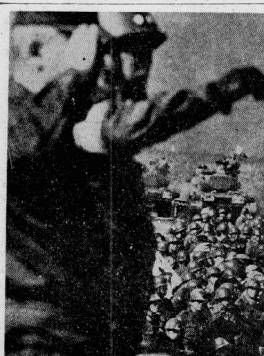
プロレタリア革命の武装闘争のあり方を示している。

プロレタリア革命の武装闘争は、プロレタリアアートの根源である。プロレタリアアートは、プロレタリア階級の生活と闘争を表現する芸術形式である。このプロレタリアアートは、プロレタリア階級の意識を高め、プロレタリア革命の成功を促進する役割を果たしている。