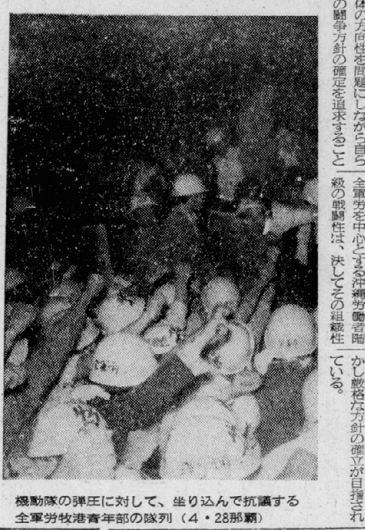
運動場の弾圧に対して、走り込んで抗議する全学労連青年部の隊列(4・28撮影)

現代の眼 5月号 特集は、若者の生活や教育問題が注目を集めている。若者の生活は、経済的負担の増大や就職難の影響を受けている。教育問題では、少子化が進む中で、教育費の負担が重くのしかかっている。また、環境問題や高齢者の生活問題も、社会的課題として浮上っている。