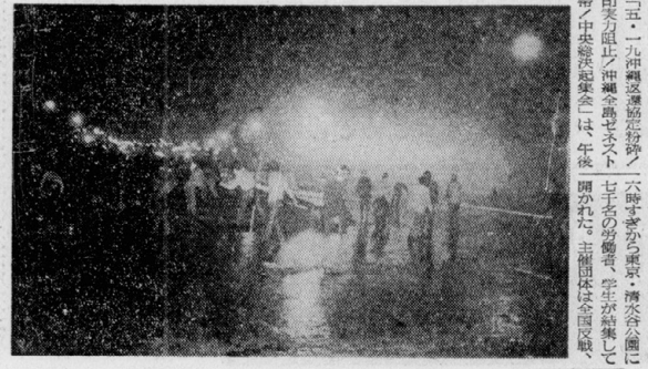
調印阻止実力闘争へ、各所にバリケードを構築

【本島本島特派員】米軍基地の機能マヒを目的として、五月十九日、全島ゼネストを実施した。このゼネストは、米軍基地の機能マヒを目的として、全島で展開された。米軍基地の機能マヒは、米軍基地の機能マヒを目的として、全島で展開された。米軍基地の機能マヒは、米軍基地の機能マヒを目的として、全島で展開された。