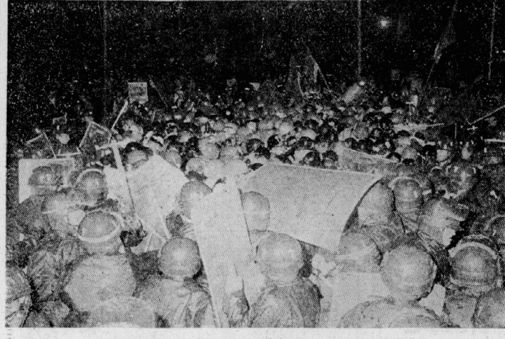
四本通りいっぱいひらけて進む京大の部隊。(19日午後9時)機動隊に囲まれての激しい陣営にも隊列は崩れなかった。