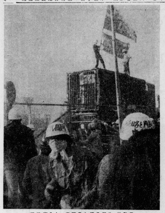
基地突入し、赤旗をたてる学生、労働者

【沖縄本島特派員】日本共産党本部は、沖縄本島に於ける米軍基地の機能マヒを目的として、五月十九日、全島ゼネストを実施した。このゼネストは、米軍基地の機能マヒを目的として、全島で展開された。米軍基地の機能マヒは、米軍基地の機能マヒを目的として、全島で展開された。米軍基地の機能マヒは、米軍基地の機能マヒを目的として、全島で展開された。