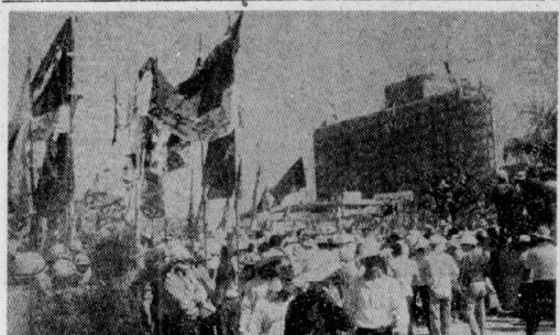
19日、那覇市与儀公園で開かれた県民議決大会。5万余の労働者、学生、市民が参加した。

復帰運動の解体と階級戦線の突出 復帰運動の解体と階級戦線の突出 復帰運動の解体と階級戦線の突出 復帰運動の解体と階級戦線の突出