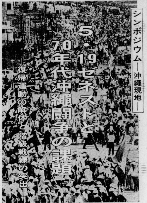
シンポジウム—沖繩現地— 5・19ゼネストと 70年代沖繩闘争の課題 復帰運動の解体と階級戦線の突出

出席者 本紙編集部特派員 大城信一(マスコミ労) 比嘉良政(自治労) 所 那覇市官公労共済会館