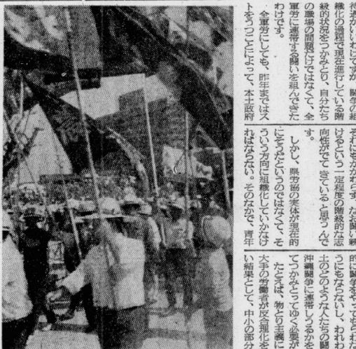
5万余の労働者が与儀公園からデモに出発した。

復帰運動の解体と階級戦線の突出 復帰運動の解体と階級戦線の突出 復帰運動の解体と階級戦線の突出 復帰運動の解体と階級戦線の突出